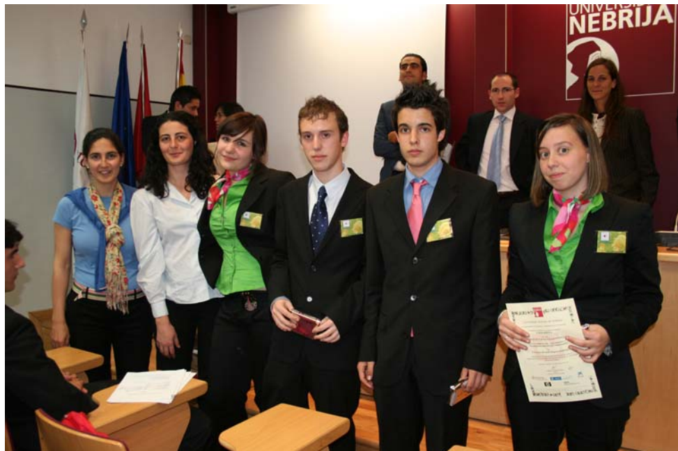
Colegio La Salle-Santiago. "Farmarrisa"