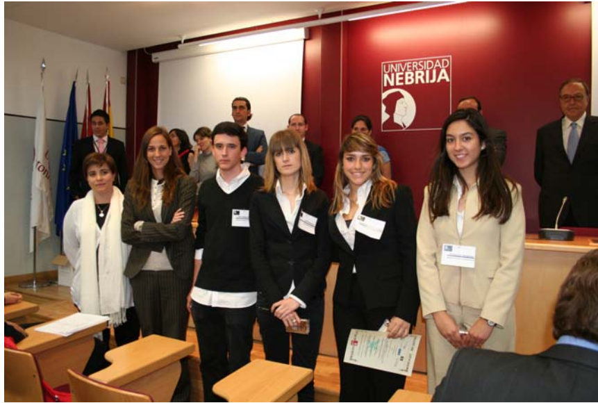
Colegio La Salle-Paterna: "Advertisement traffic phone"