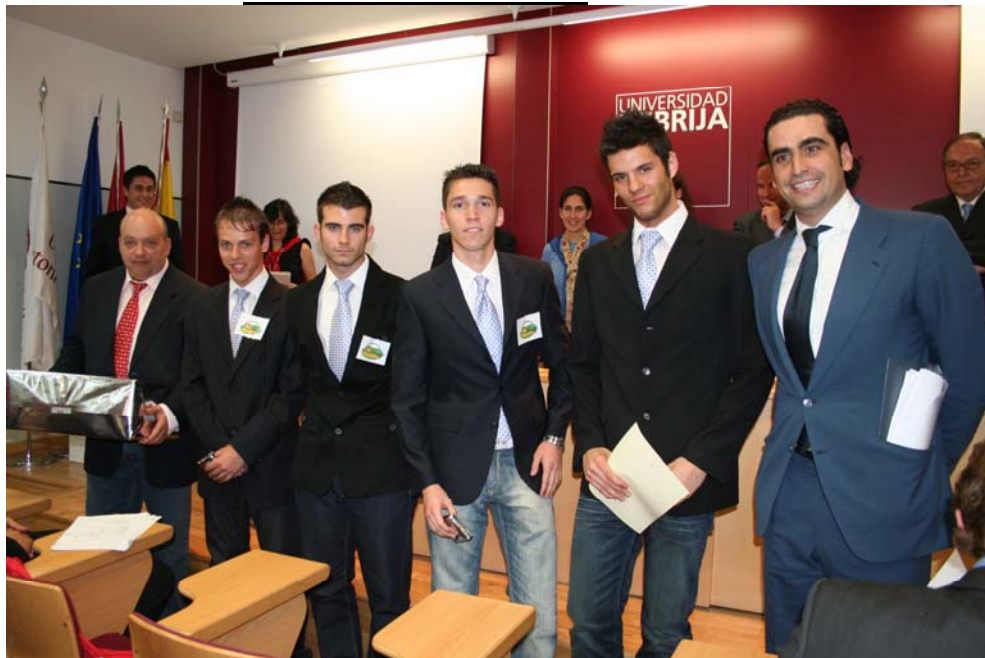
IES Figueras Pacheco. "Mi Huertito"

De este día podemos destacar la positiva experiencia de relacionar diferentes grupos de trabajo en torno al emprendimiento: alumnos de toda España, tutores, alumnos de la Universidad Nebrija, empresarios, patrocinadores y profesores de distintas áreas.