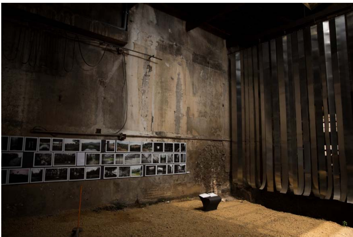
Exposición de fotografías: RCR Landscapes , de Emiliano Roia.