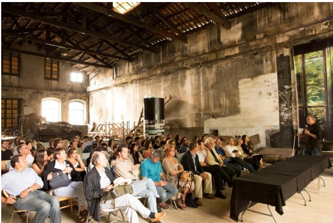
Clausura del curso. Presentación de los trabajos.