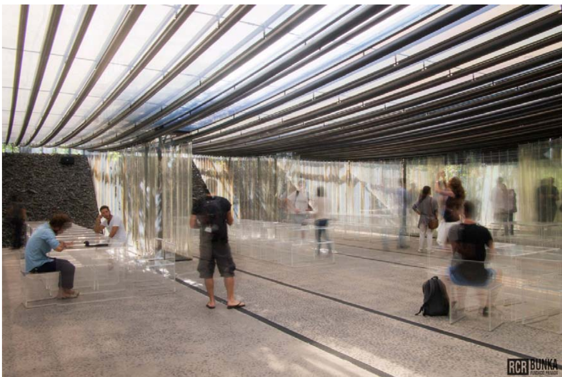
Visita de obras en la Carpa del Restaurant Les Cols (Olot).