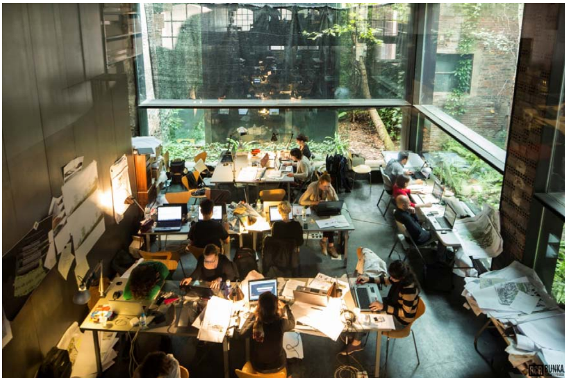
Día de trabajo en el Taller Creativo