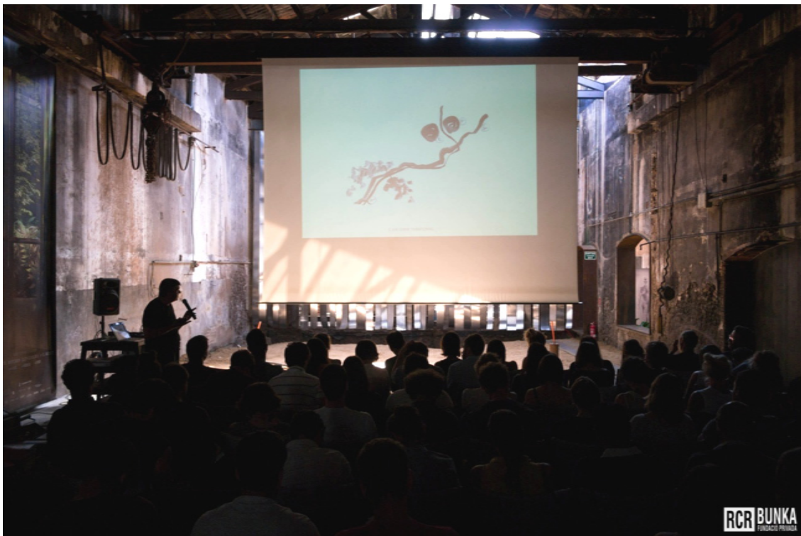
Conferencia de Rafael Aranda: RCR y el lugar .