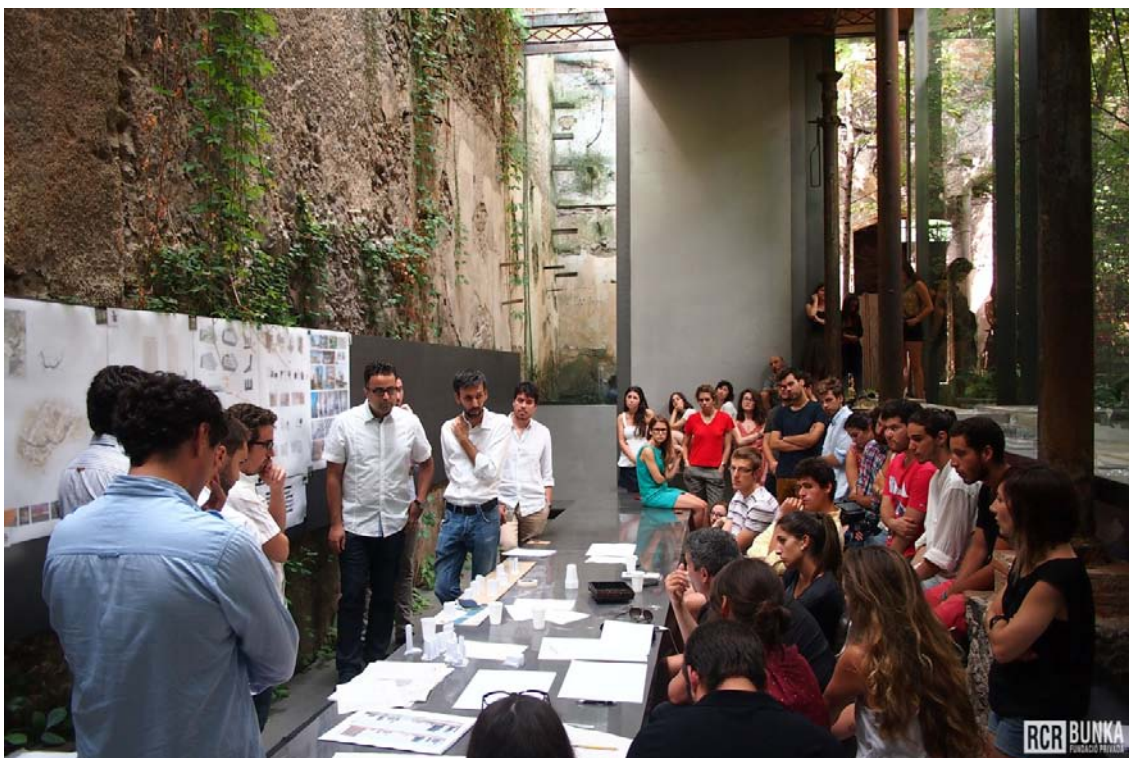
Una de las sesiones de corrección de proyectos en el Pabellón de los Sueños.