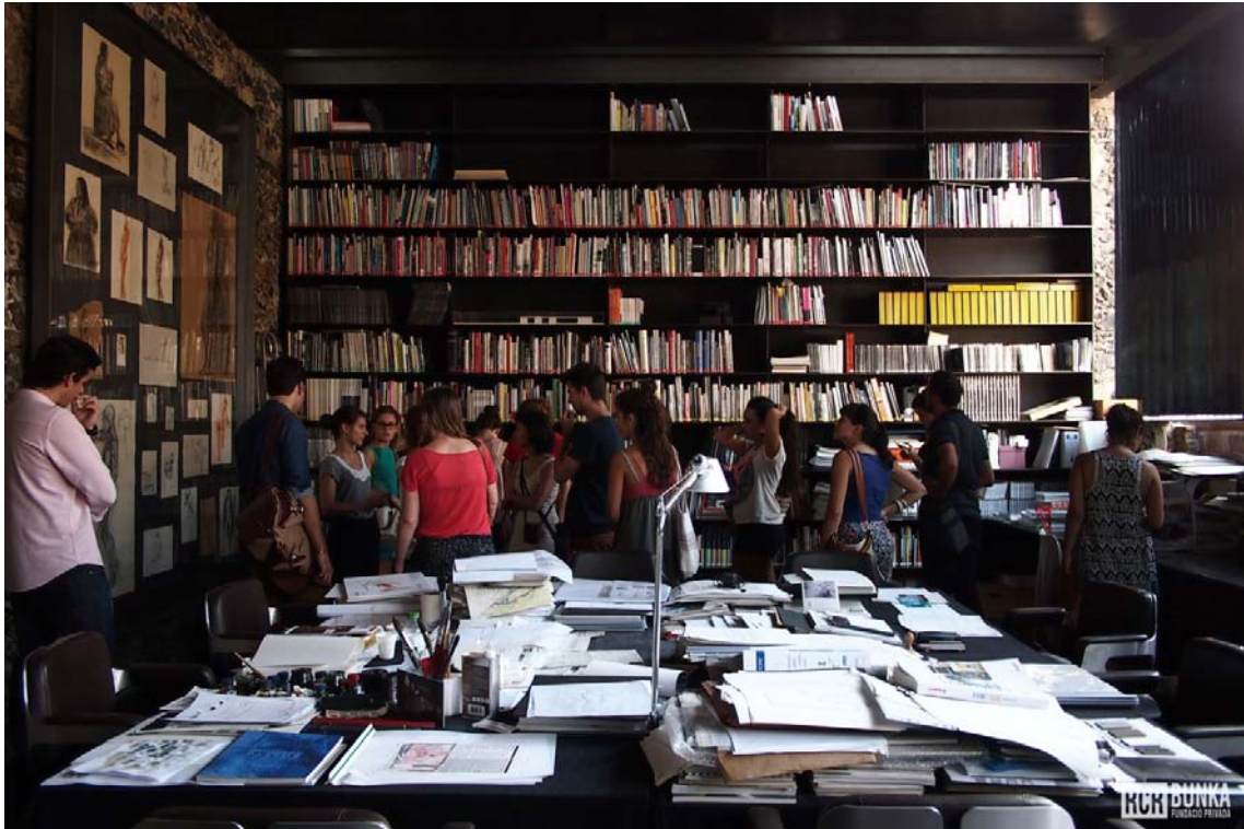
Inauguración del curso. Visita guiada en el Espai Barberí.