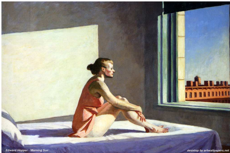
Edward Hopper - Morning Sun