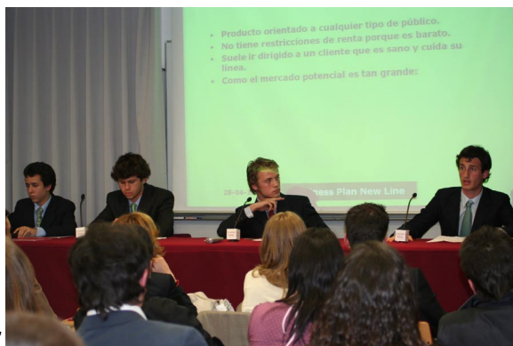
Finalista "New Line"