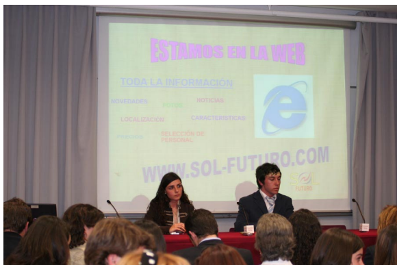
Finalista "Energía Solar Sociedad Moderna"