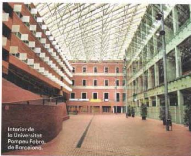
Interior de la Universitat Pompeu Fabra, de Barcelona.

mente en másteres. Su oferta académica incluye 44 grados, 39 dobles grados, 73 másteres y 62 títulos propios, con una estructura que combina áreas como comunicación, artes, diseño, ciencias de la salud, ingeniería, arquitectura, empresa, derecho, relaciones internacionales, lenguas y educación. La formación práctica se apoya en platós de televisión, estudios de radio y podcasting, redacción multimedia, laboratorios de edición y posproducción, talleres de moda, espacios escénicos, laboratorios de salud, aulas informáticas especializadas, instalaciones deportivas y espacios de prototipado e impresión 3D.