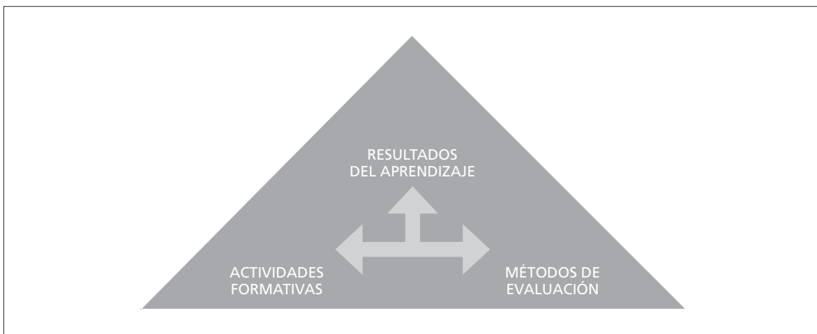
FIGURA 2: Triangulación entre RA, actividades formativas y métodos de evaluación

ANECA considera de vital importancia la alineación entre actividades formativas, sistemas de evaluación y resultados del aprendizaje. El Protocolo de evaluación para la verificación de títulos universitarios oficiales (Grado y Máster) señala, en su criterio 5, que El plan de estudios debe mostrar una coherencia interna global entre las competencias, los contenidos, los resultados