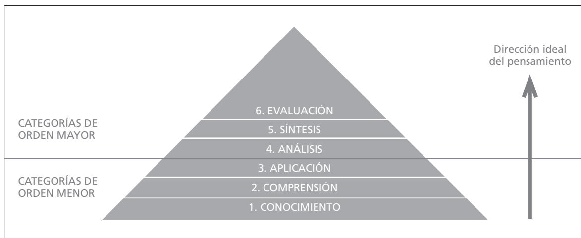
FIGURA 1: Dirección ideal del pensamiento según la Taxonomía de Bloom

Según esta estructura jerárquica, cada categoría superior está compuesta por las categorías situadas debajo de ella. Es decir, la comprensión requiere conocimiento, la aplicación demanda