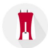
DEPARTAMENTO DE ESTUDIANTES