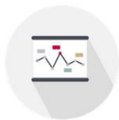
PLANIFICACIÓN Y TRANSFERENCIA