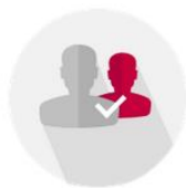
DESARROLLO UNIVERSITARIO NACIONAL