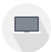
SISTEMAS Y SERVICIOS INFORMÁTICOS