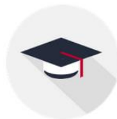
GABINETE DE RECTORADO