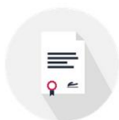
SECRETARÍA DE CURSOS

A continuación se incluye una breve descripción de las principales actuaciones de los diferentes departamentos de servicios, así como las personas responsables de cada uno de dichos departamentos.