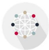
DESARROLLO UNIVERSITARIO INTERNACIONAL