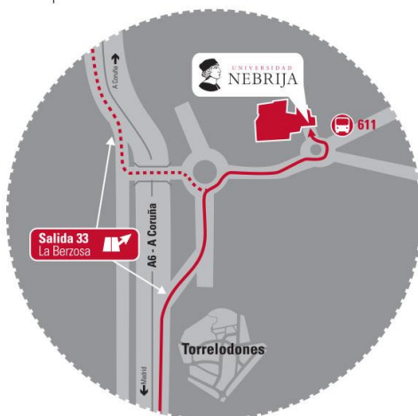
Campus de la Berzosa

Campus ubicado en la localidad madrileña de Hoyo